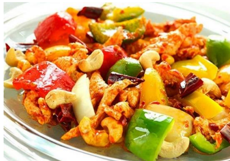
鶏肉とカシュナツの甘辛炒め