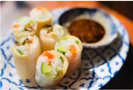
青いパイヤと野菜と揚げ豆腐の生春巻き