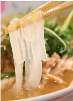
Bánh Canh Gà 「バインカン」 鶏肉タピオカもちもち麺