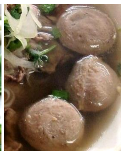
追加：牛肉団子 追加：煮込み豚足 追加：タマゴスープ