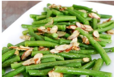
インゲン豆のにんにく炒め