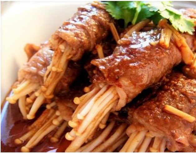
牛肉のエノキ巻き焼き