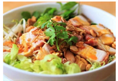
カリッカリ塩豚ライス