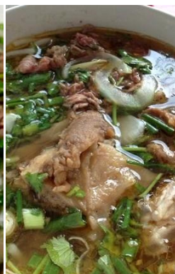
煮込み牛すじ肉のフォー