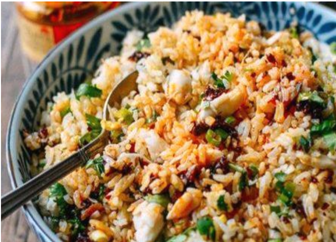
ベトナム蟹チャーハン