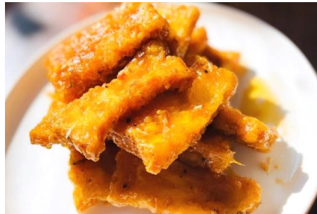
スイートチレモングラス風味カリカリ豆腐