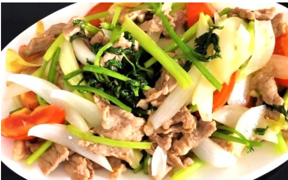
牛肉とセロリ・玉葱・トマト炒め