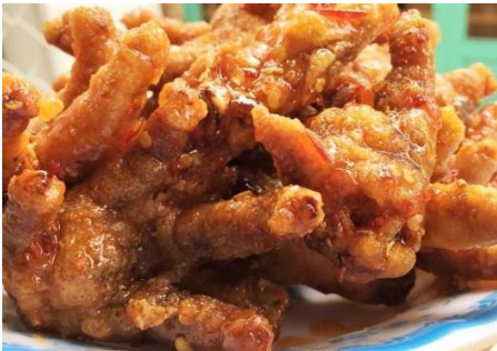
もみじのスイートチリ炒め (Chua Ngot)