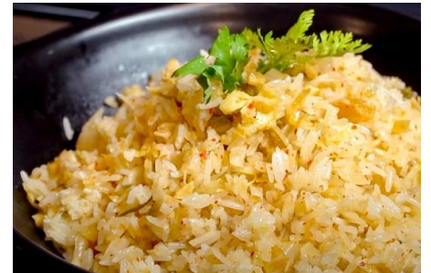
ガーリックチャーハン