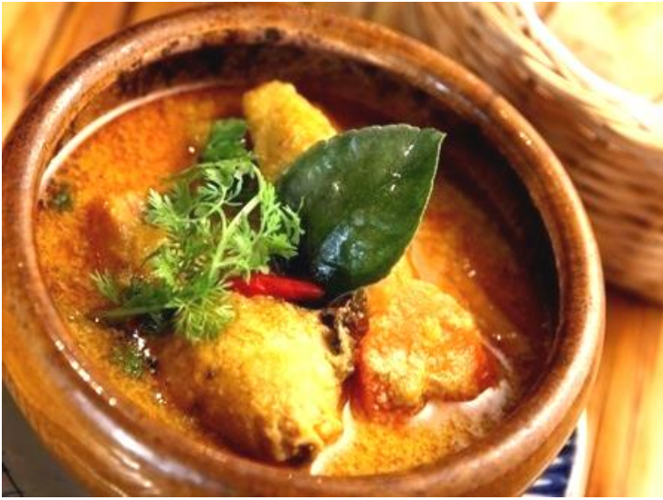
チキンのココナツカレー + ベトナムバインミー