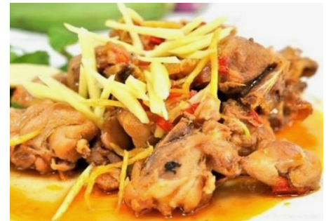
鶏肉のココナツミルク生姜炒め煮込み