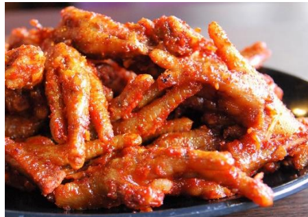
もみじのサテ炒め (Xào Sa Té)