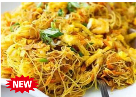
ベトナムで定番、シンガポール風焼きビーフン