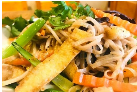
ヴィーガン焼きフォー