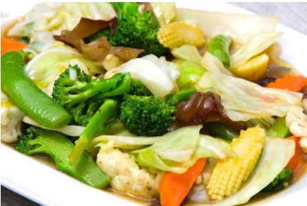
ベトナムいろいろ野菜の炒めもの