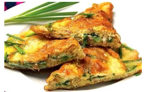
ライムリーフ風味ポテトオムレツ