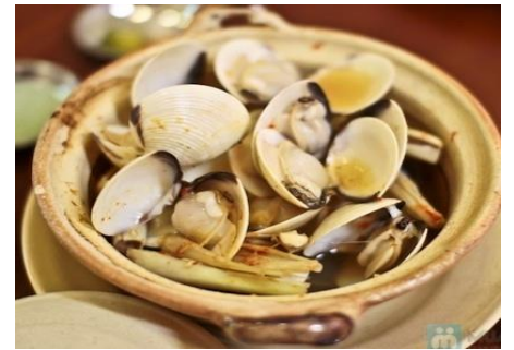
ハマグリのリモングラス蒸し