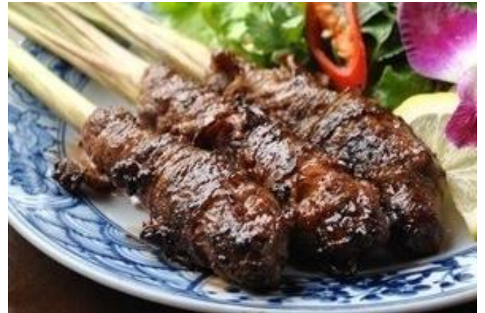
牛肉のレモングラス巻きの網焼き