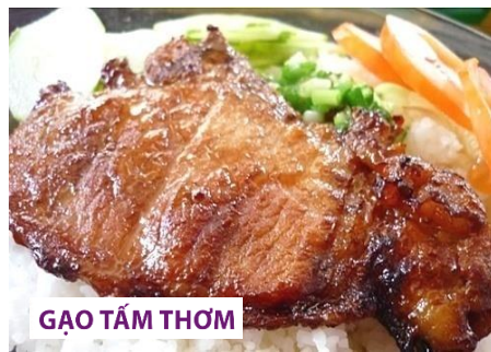
コムスン (豚焼肉のつけ皿ごはん)