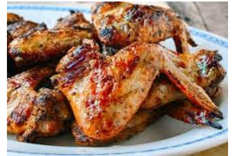
手羽先の辛いサテ焼き