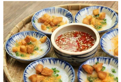
バインベオ (フエの小皿の蒸し餅 海老田麩とネギ油のせ)