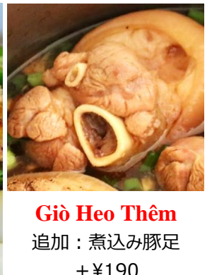
Giò Heo Thêm 追加：煮込み豚足 + ¥190