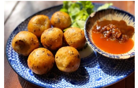
ジャガイモとキノコのレモン葉風味団子