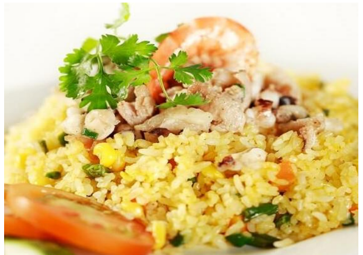
ベトナム海鮮チャーハン