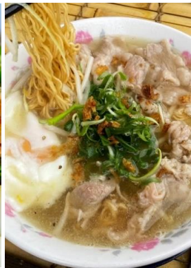
Mì Tôm Bò Trứng 「ミーボー」 牛肉と卵のラーメン