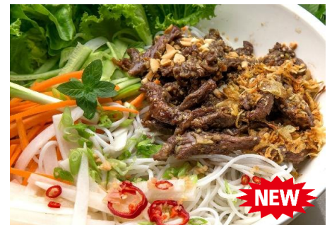
牛肉炒めと緑野菜の混ぜ混ぜ麺