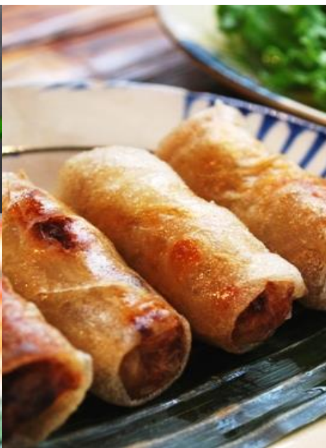
チャーゾー (揚げ春巻き)