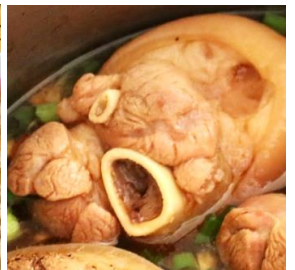
Giò Heo Thêm 追加：煮込み豚足 + ¥190