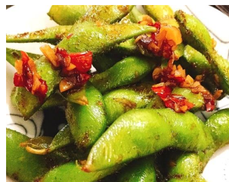
枝豆のガーリックとんがらし炒め