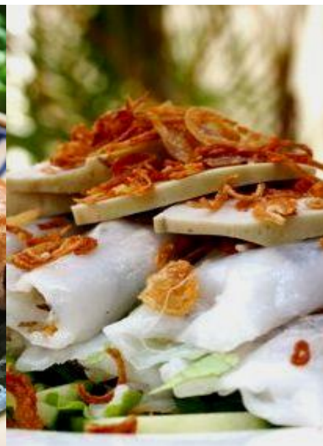
バインクン (蒸し春巻き)