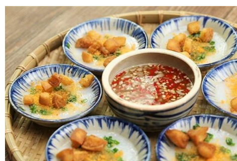
バインベオ (フエの名物 小皿の蒸し餅)