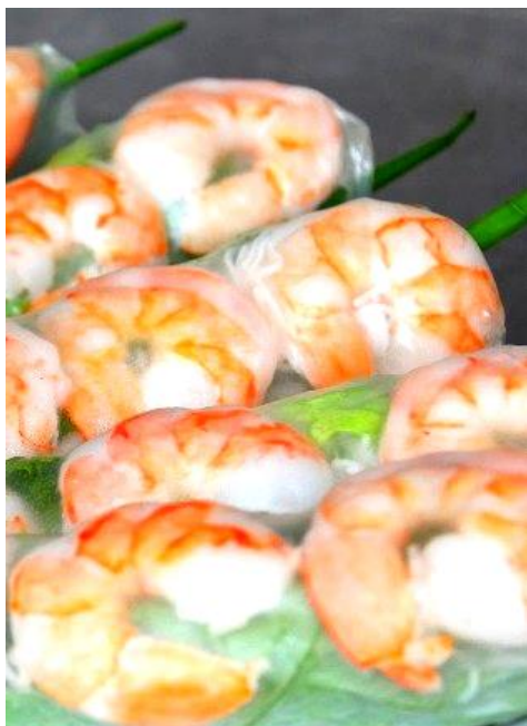
ゴイクン (生春巻き)