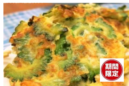
ゴーヤの焼きオムレツ