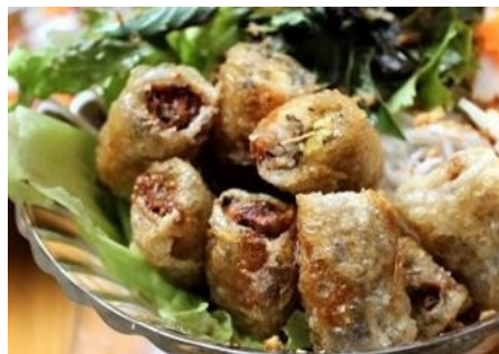
揚げ春巻きの緑野菜の混ぜ混ぜ麺