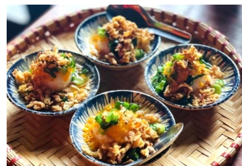
バインイト (海老のもちもち蒸し団子)