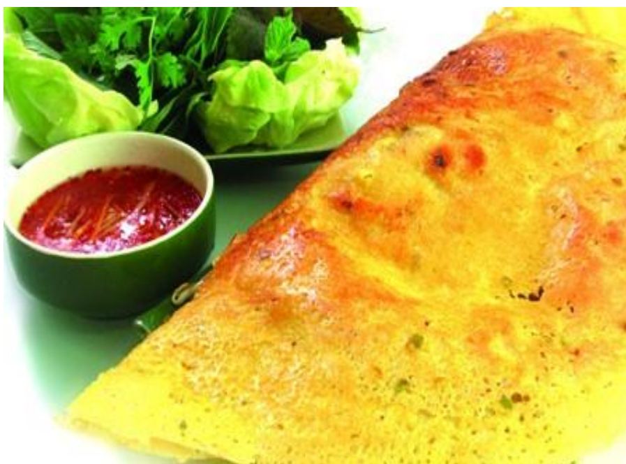
バインセオ (ベトナム版お好み焼き)