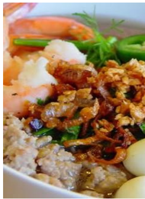
Hủ Tiếu Nam Vang 「フーティユナンヴァン」 メコンデルタの汁麺