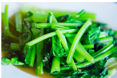
旬の青菜のんにく炒め