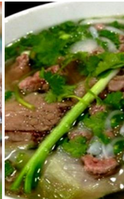
茹で牛すね肉のフォー