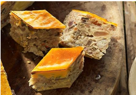
ひき肉と海老のふわふわ卵とじ蒸し