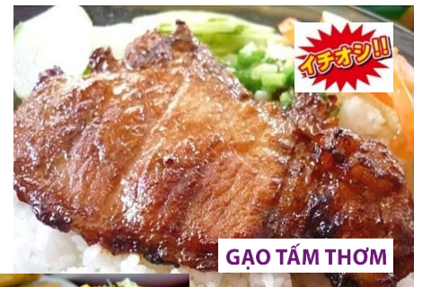
GAO TAM THONG