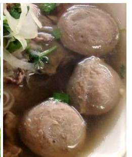
追加：牛肉団子 追加：煮込み豚足 追加：タマゴスープ