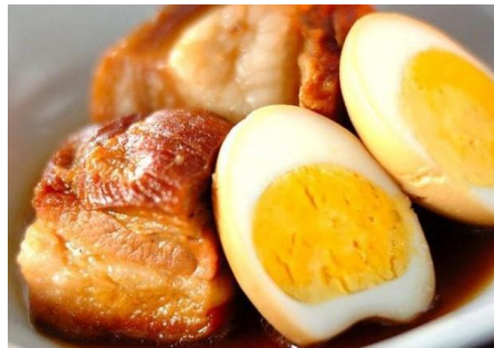
豚の角煮と煮卵 ～ココナッツジュース煮～