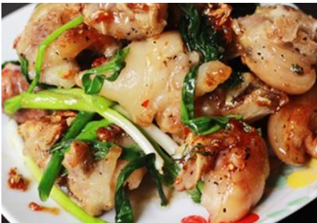
豚足の甘辛ヌックナム炒め