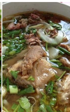
煮込み牛すじ肉のフォー