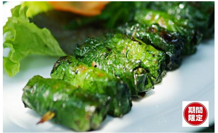
牛肉のロット(葡萄)の葉包み焼き ライスペーパーで巻いて