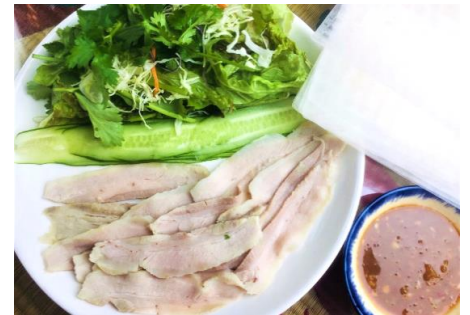
ベトナムの茹で豚 ライスペーパーで巻いて