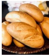
ボークー 牛肉と人参のスパイシー煮込み + ベトナムバインミー