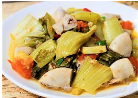
豚ホルモンと高菜のピリ辛炒め