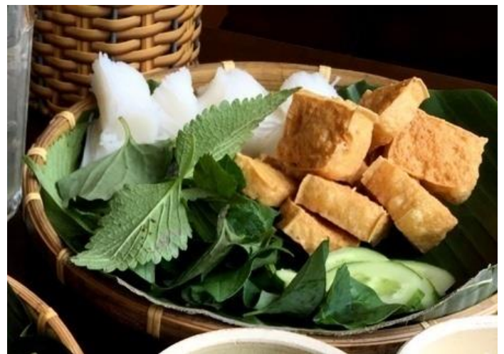
あげ豆腐の発酵海老ダレビーフン